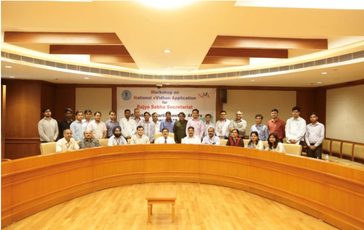
[9 अप्रैल, 2019 को संसदीय सौध, नई दिल्ली में आयोजित कार्यशाला में भाग लेने वाले राज्य सभा सचिवालय के प्रतिभागियों का समूह फोटोग्राफ]

प्रसंस्करण, कार्यसूची उतपत्ति, सूचना प्रसंस्करण जैसे विभिन्न मॉड्यूलों पर व्यापक व्याख्यान शामिल थे। दो तकनीकी सत्रों के बाद पूछताछ सत्र आयोजित किया गया, जिसमें अधिकारियों ने सचिवालय के काम में उन्हें पेश आने वाले मुद्दों के बारे में कई बातें उठाईं। उन्हें सुझाव या आगे के विचारों के साथ आने के लिए भी प्रोत्साहित किया गया जो इस परियोजना को अगली श्रेणी में ले जाने में मदद करेंगे। सभी मुद्दों का संयुक्त सचिव, संसदीय कार्य मंत्रालय और नेवा टीम द्वारा समाधान किया गया। संयुक्त सचिव ने सभी अधिकारियों से एप्लीकेशन में प्रविष्टियां शुरू करने का आग्रह किया, जो अंततः उनके प्रमुख मॉड्यूलों को ऐप में मुख्यधारा में लाने में मदद करेगा। दो तकनीकी सत्रों के बाद संयुक्त सचिव, संसदीय कार्य मंत्रालय द्वारा धन्यवाद ज्ञापन और समापन संबोधन हुआ, जिसमें उन्होंने सत्र में अपार सहयोग और सक्रिय भागीदारी के लिए सभी अधिकारियों की सराहना की और डिजिटल लोकतंत्र में एक बड़ा मील-पत्थर उपार्जित करने में परियोजना की सफलता के लिए सीपीएमयू टीम के साथ मिलकर काम करने का आग्रह करते हुए एप्लीकेशन को अपनाने में उन्हें सीपीएमयू, नेवा टीम से निरंतर मदद का आश्वासन दिया। इसके बाद, प्रतिभागियों को संयुक्त सचिव द्वारा सराहना और प्रोत्साहन के संकेत के रूप में प्रतिभागिता प्रमाण-पत्र से सम्मानित किया गया।