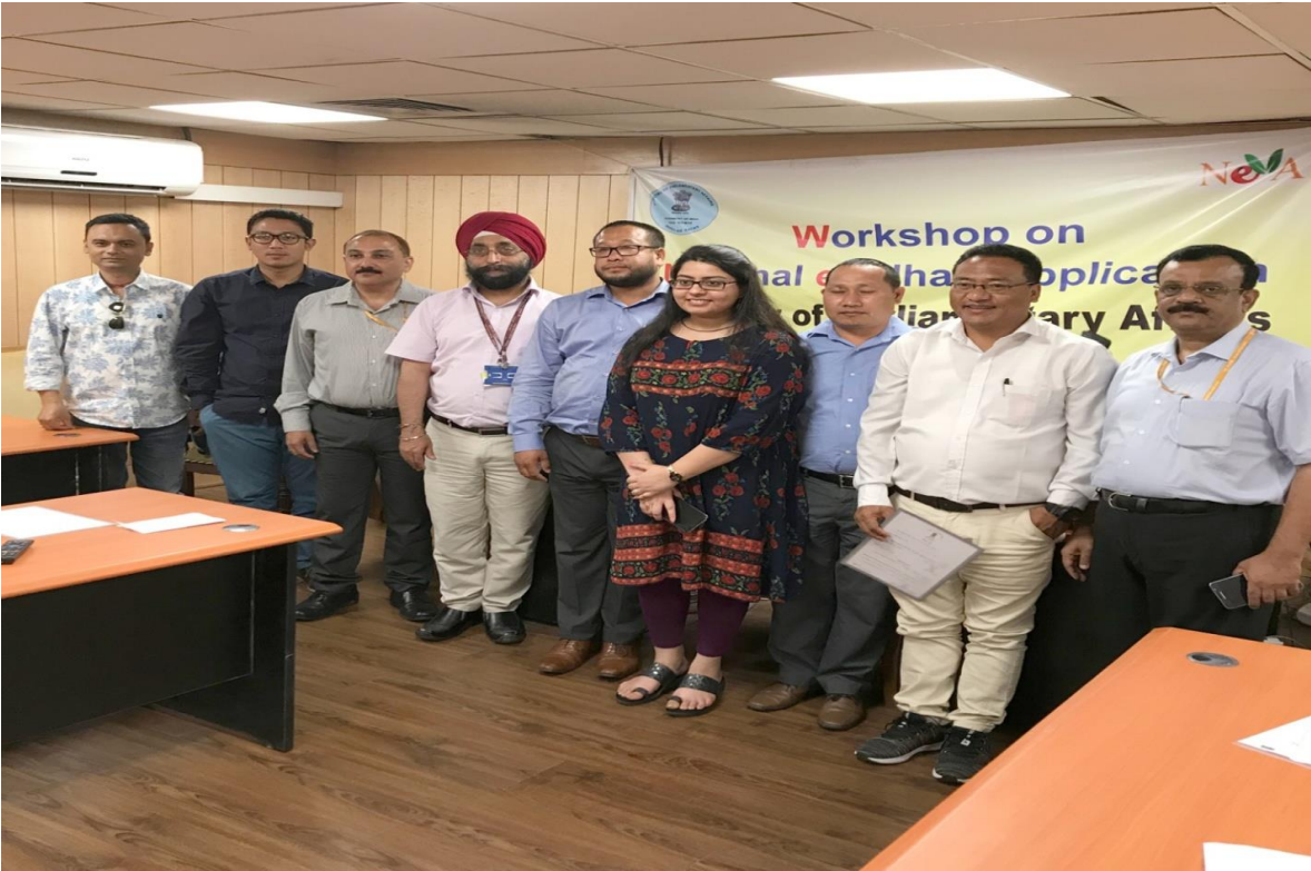
[सीपीएमयू नेवा, संसदीय सौध, नई दिल्ली में 22-24 अप्रैल, 2019 को आयोजित चरण-॥ की कार्यशाला में भाग लेने वाले मणिपुर विधानसभा के प्रतिभागियों का समूह फोटोग्राफ]