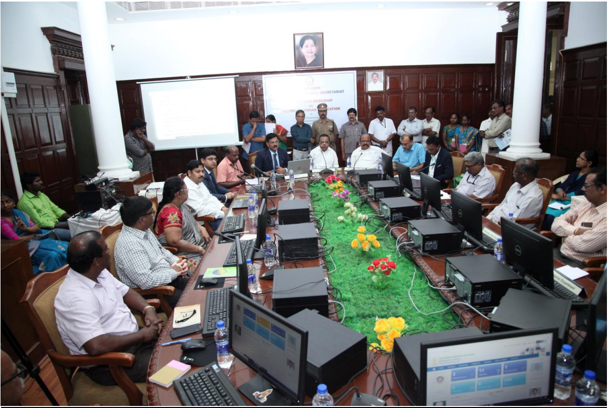
[25-26 नवंबर, 2019 को तमिलनाडु विधानसभा, चेन्नई में तमिलनाडु विधानसभा के लिए आयोजित चरण-। की अभिविन्यास कार्यशाला]

12.17 पूर्ववर्ती क्षमता निर्माण उपायों के क्रम में, इन ऊपर उल्लिखित प्रशिक्षणों का सीपीएमयू, नेवा, संसदीय सौध, दिल्ली में 13 विधायी सदनों के लिए तीन दिन की चरण-॥ की गहन प्रशिक्षण कार्यशालाओं के संचालन के साथ संवर्धन किया गया जिनमें नोडल अधिकारियों के दल और विभिन्न राज्यों के स्टाफ, जो चरण-। का प्रशिक्षण पहले ही पा चुके हैं, को प्रशिक्षण और अभ्यासिक सत्र में गहन प्रशिक्षण दिया गया। वर्ष 2019 में संचालित कार्यशालाओं को नीचे सारणीबद्ध किया गया है:-