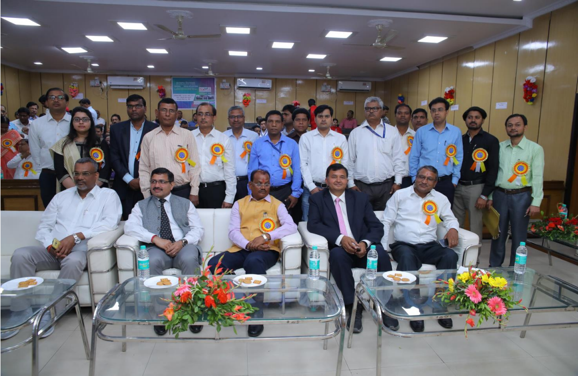
[26-27 मार्च, 2019 को झारखंड विधानसभा, रांची में झारखंड विधानसभा के लिए आयोजित चरण-1 की अभिविन्यास कार्यशाला को संबोधित करते हुए।]