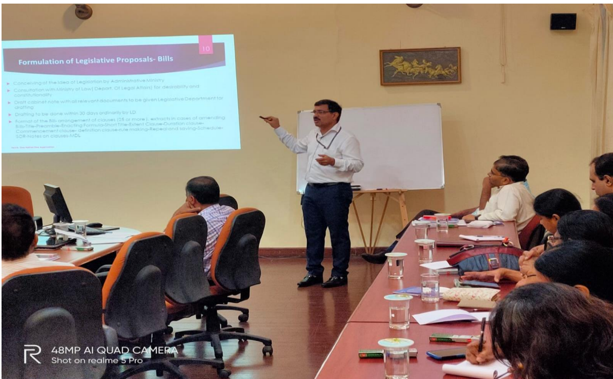
(दिनांक 04.10.2019 को परमाणु ऊर्जा विभाग, मुम्बई के अधिकारियों/कर्मचारियों के लिए आयोजित अभिविन्यास कार्यशाला)