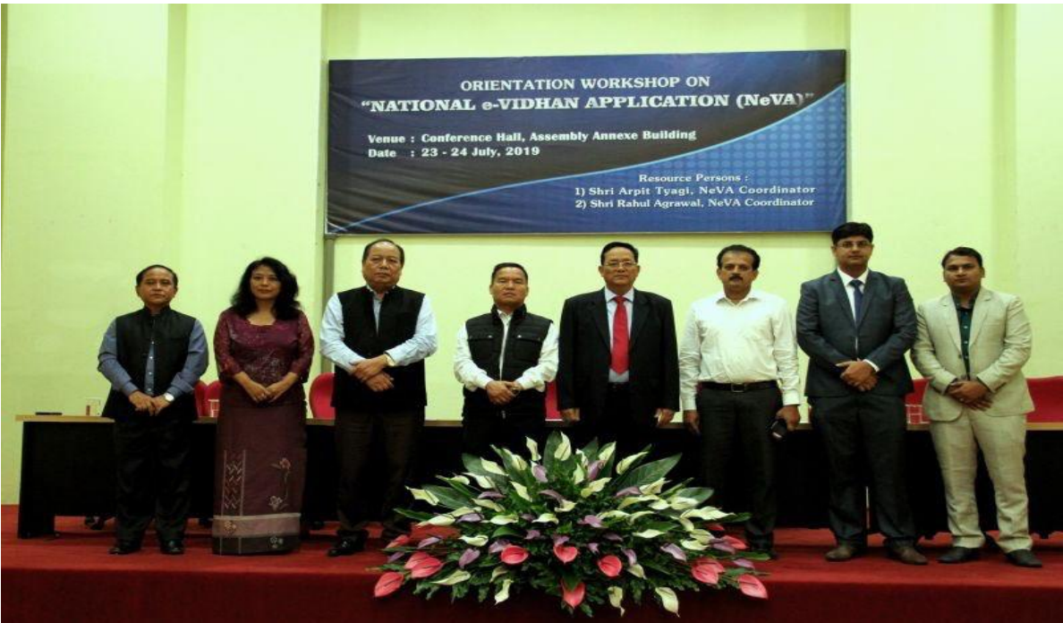
[23-24 जुलाई, 2019 को मिजोरम विधानसभा, आइजोल में मिजोरम विधानसभा के लिए आयोजित चरण-1 की अभिविन्यास कार्यशाला]