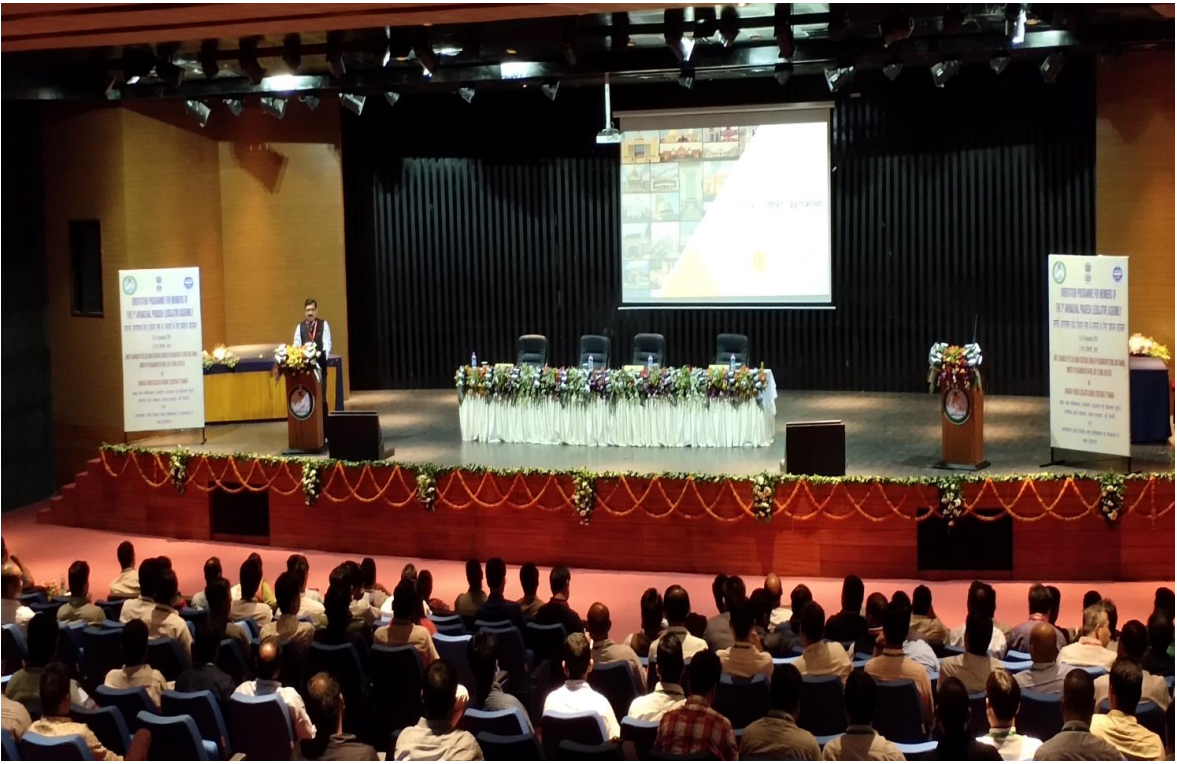
[संयुक्त सचिव, संसदीय कार्य मंत्रालय 5-6 सितंबर, 2019 को अरुणाचल प्रदेश विधानसभा, इटानगर में अरुणाचल प्रदेश विधानसभा के विधायकों को संबोधित करते हुए]