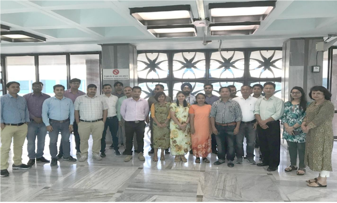
[सीपीएमयू नेवा, संसदीय सौध, नई दिल्ली में 13-15 मई, 2019 को आयोजित चरण-II की कार्यशाला में भाग लेने वाले मेघालय विधानसभा के प्रतिभागियों का समूह फोटोग्राफ]