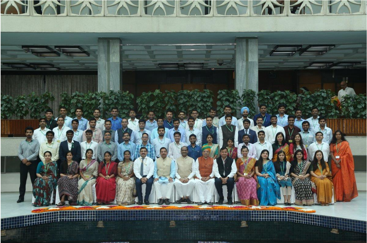
[17 जुलाई, 2019 को सहायक सचिवों के लिए संसदीय प्रक्रिया और पद्धति पर अभिविन्यास पाठ्यक्रम]