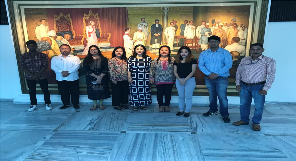
[सीपीएमयू नेवा, संसदीय सौध, नई दिल्ली में 16-18 मई, 2019 को आयोजित चरण-II की कार्यशाला में भाग लेने वाले अरुणाचल प्रदेश विधानसभा के प्रतिभागियों का समूह फोटोग्राफ]