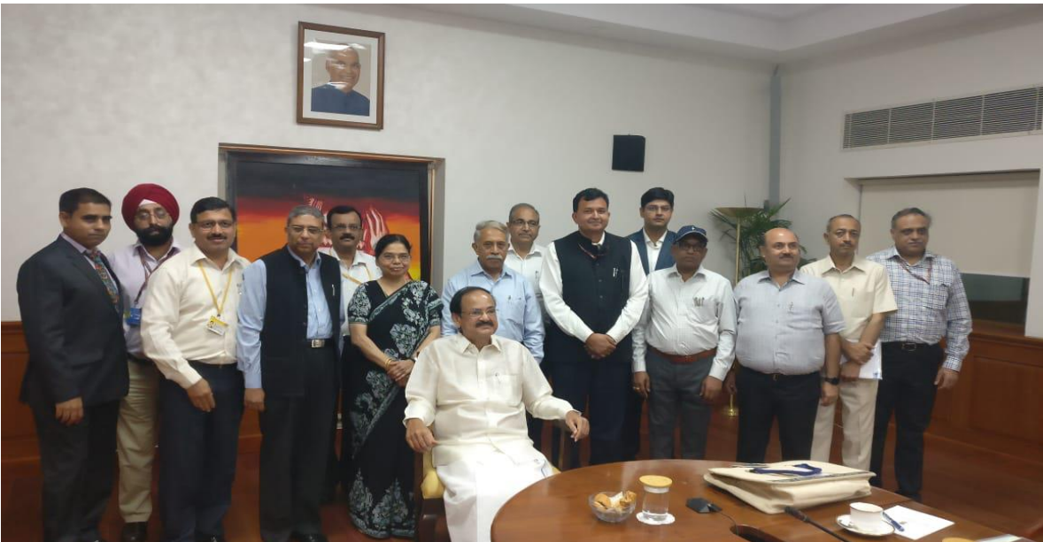
[7 मई, 2019 को उप-राष्ट्रपति भवन, नई दिल्ली में भारत के माननीय उप-राष्ट्रपति और राज्य सभा के सभापति द्वारा नेवा की समीक्षा]

12.31 सत्र अध्यक्ष की ओर से धन्यवाद ज्ञापन और समापन टिप्पणी के साथ समाप्त हुआ जिसमें उन्होंने नेवा एप्लीकेशन के विकास के माध्यम से विधानमंडलों का डिजिटलीकरण करने की दिशा में संसदीय कार्य मंत्रालय द्वारा की गई पहल और प्रयासों की सराहना की। इसके अलावा, अध्यक्ष ने कहा कि नेवा एप्लीकेशन सदन में सरकारी कार्य के निष्पादन में सदस्यों की सहायता करने वाला उपकरण है और उन्होंने इच्छा व्यक्त की कि दोनों सचिवालयों के अधिकारीगण अपने-अपने सदनों में नेवा को उपयोग करने की व्यावहारिकता का पता लगाने के लिए बैठक कर सकते हैं।