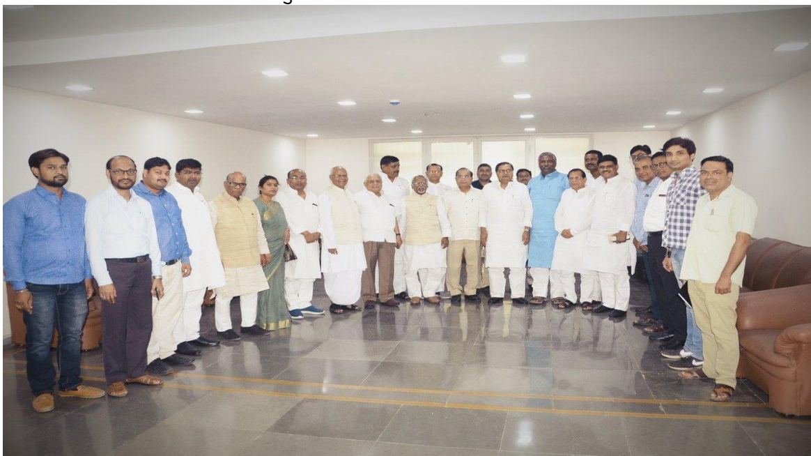
[बिहार विधान परिषद, पटना में 3 जून, 2019 को चरण-III की कार्यशाला में माननीय विधान परिषद सदस्यों का प्रशिक्षण]

12.37 बिहार विधान परिषद देश का पहला सदन बन गया है जहां नेवा (राष्ट्रीय ई-विधान एप्लीकेशन) साफ्टवेयर के माध्यम से, माननीय सदस्य अपने मोबाइल फोन पर तारांकित, अतारांकित और अधिसूचित प्रश्न आदि पूछ सकते हैं। परिषद सचिवालय विधान परिषद सदस्यों द्वारा प्रस्तुत ऑनलाइन प्रश्नों को नेवा मोबाइल और वेब प्लेटफॉर्म के माध्यम से स्वीकार कर रहा है। प्रश्न भी नेवा के प्रश्न प्रसंस्करण प्रणाली के माध्यम से संसाधित किए जाते हैं और प्रश्नों के लिए अंतिम सूची कार्य प्रवाह आधारित नेवा आर्किटेक्चर के माध्यम से ऑनलाइन तैयार की जाती है। यहां तक कि प्रश्न विभागों को ऑनलाइन भेजे जाते हैं और विभागों को अपना उत्तर ऑनलाइन भेजने की सुविधा है।