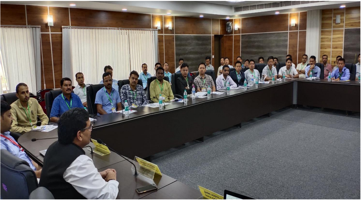
[अरुणाचल प्रदेश विधानसभा, इटानगर में 5-6 सितंबर, 2019 को आयोजित तीसरे चरण की कार्यशाला में माननीय विधायकों के वैयक्तिक/निजी सहायकों का प्रशिक्षण]