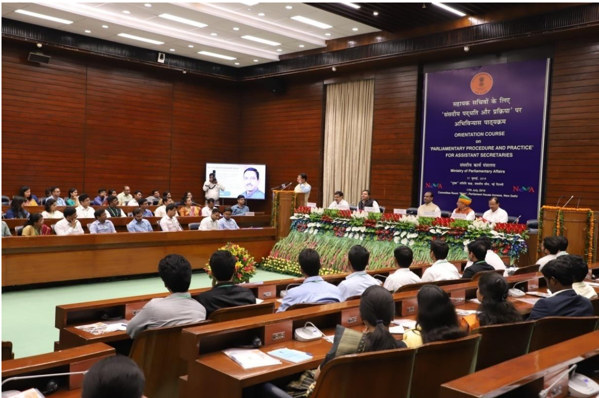
(2017 बैच के नए आई.ए.एस. अधिकारियों के लिए 17 जुलाई, 2019 को संसद भवन में अभिविन्यास कार्यशाला का आयोजन किया गया)