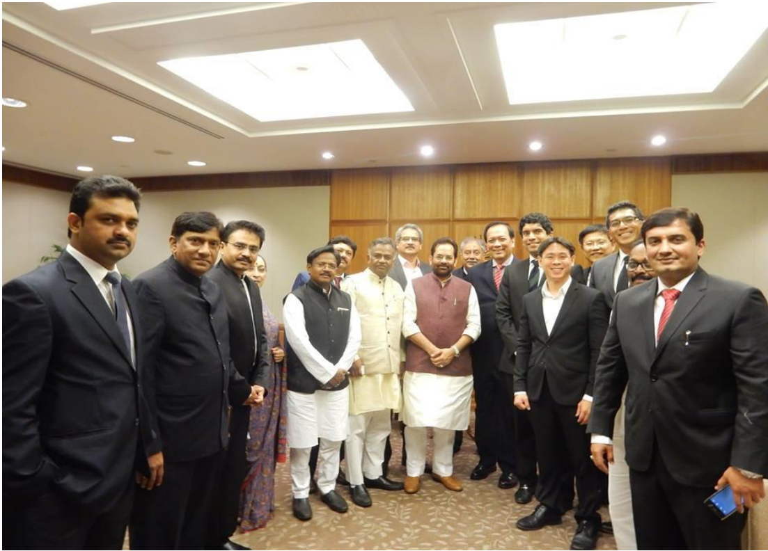
(शिष्टमंडल ने श्री चार्ल्स चॉंग, सिंगापुर संसद के उपाध्यक्ष से मुलाकात की)

9.6 संसदीय शिष्टमंडल के लिए डॉ. मोहम्मद मलीकी बिन उसमान, विदेशी और रक्षा मामलों के वरिष्ठ राज्य मंत्री ने सरकारी रात्रिभोज की मेजबानी की। रात्रिभोज के दौरान, दोनों ओर के सदस्यों ने व्यापार और द्विपक्षीय संबंधों से जुड़े मामलों पर चर्चा की। राज्य मंत्री ने माननीय प्रधान मंत्री श्री नरेन्द्र मोदी के नेतृत्व के अधीन भारत में समावेशी आर्थिक विकास एवं उन्नति को प्रोत्साहित करने के लिए की जा रही विभिन्न पहलों के बारे में बात की। डिजिटल इंडिया, मेक इन इंडिया, स्वच्छ भारत, पूरे देश में मल्टी-लेन एक्सप्रेसवे तथा स्मार्ट सिटीज के निर्माण जैसे कुछ कार्यक्रमों के बारे में मूलभूत सूचना को भी साझा किया गया। उन्होंने भारत-सिंगापुर संबंधों पर चर्चा की और दोनों देशों में सर्वोत्तम पद्धतियों और विकास पर विचारों का आदान-प्रदान किया।