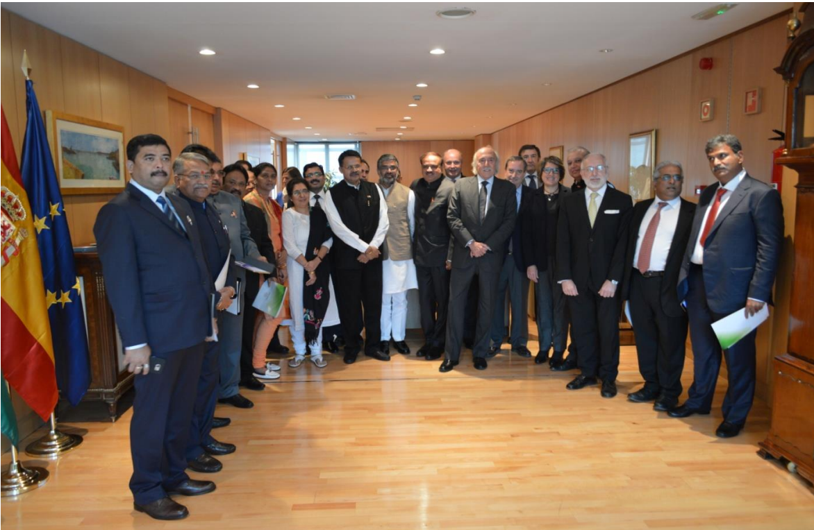
[शिष्टमंडल ने स्पेन-इंडिया काउंसिल फाउंडेशन (एस.आई.सी.एफ.) के बोर्ड के सदस्यों से मुलाकात की]

9.52 माननीय मंत्री दिनांक 20.10.2016 को 2315 बजे फ्रैंकफर्ट से मैड्रिड पहुंचे और शिष्टमंडल में पुनः शामिल हो गए। 21 अक्टूबर को शिष्टमंडल ने माननीय संसदीय कार्य मंत्री के नेतृत्व में स्पेन-इंडिया काउंसिल फाउंडेशन (एस.आई.सी.एफ.) के बोर्ड के सदस्यों से मुलाकात की। एस.आई.सी.एफ. को एकल सिविल समाज के मंच पर द्विपक्षीय संबंधों को मजबूत करने, भारत को प्रभावित करने वाले कार्यकलापों के क्षेत्रों जैसे कि आर्थिक और वाणिज्यिक, शैक्षिक, संस्कृति, विज्ञान और प्रौद्योगिकी से संबंधित आपसी हितों को प्रोत्साहित करने के उद्देश्य से स्पेन में विविध क्षेत्रों में किए जा रहे प्रयासों को सुदृढ़ करने के उद्देश्य के साथ स्पेन के विदेश और सहकारिता मंत्रालय द्वारा प्रोत्साहन और सहायता प्रदान की जाती है। फाउंडेशन के सदस्यों में स्पेन के विदेश मंत्रालय, व्यापारिक समुदाय, निवेशक मंच और सांस्कृतिक घरानों के प्रतिष्ठित प्रतिनिधि शामिल हैं। बोर्ड के सदस्यों ने संक्षिप्त परिचय के पश्चात भारत के संबंध में उनके संस्थानों द्वारा किए जा रहे कार्य का सिंहावलोकन प्रस्तुत किया। स्पेन की नेवंतिया, इंद्रा, गैस नैचुरल फेनोसा, अबेन्गोवा, एक्सीओना जैसी कंपनियों के प्रतिनिधियों ने भारत में अपने प्रचालनों का विवरण दिया जबकि इंस्टीटूटो सेरवांटेस, कासा इंडिया और कासा द ला इंडिया भारत की सांस्कृतिक पहुंच में अपनी भागीदारी के बारे में बोले। संस्थागत रूख पर, स्पेन के विदेश कार्यालय, विदेश मंत्रालय की सार्वजनिक राजनयिक शाखा और मैड्रिड की सिटी काउंसिल में भारत से संबंध रखने वाले प्रादेशिक प्रभाग के महानिदेशक ने भारतीय दूतावास के माध्यम से भारत के साथ अपनी गतिविधियों और कार्यों के बारे में संक्षिप्त विवरण दिया।