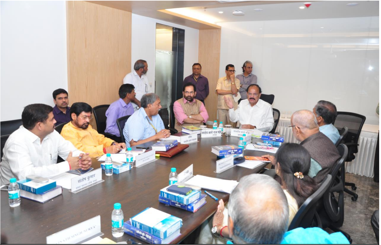
तत्कालीन संसदीय कार्य मंत्री, श्री एम. वेंकैया नायडु 30 मार्च, 2016 को हिंदी सलाहकार समिति की बैठक लेते हुए

11.6 मंत्रालय में राजभाषा अधिनियम और राजभाषा नियमों के उपबंधों का अनुपालन सुनिश्चित करने तथा हिन्दी के प्रयोग संबंधी उपबंधों के कार्यान्वयन पर लगातार निगरानी रखने के लिए मंत्रालय के अनुभागों का निरीक्षण किया जाता है। प्रतिवेदित अवधि के दौरान तीन अनुभागों का निरीक्षण किया गया।