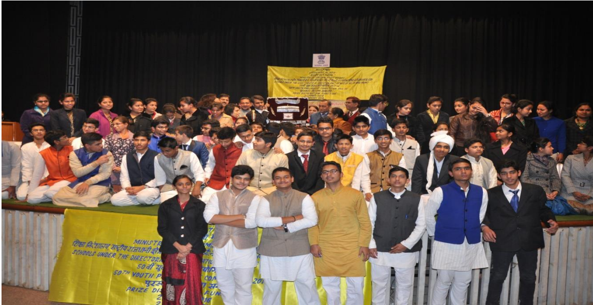
[50वीं युवा संसद प्रतियोगिता के अवसर पर ग्रीनफील्ड पब्लिक स्कूल, दिलशाद गार्डन, दिल्ली के विद्यार्थी]

10.2 50वीं युवा संसद प्रतियोगिता, 2015-16 का पुरस्कार वितरण समारोह 21 जनवरी, 2016 को जी.एम.सी. बालयोगी सभागार, संसद ग्रंथालय भवन, नई दिल्ली में आयोजित किया गया। दिल्ली विद्यालयों के लिए 50वीं युवा संसद प्रतियोगिता, 2015-16 के विजेता ग्रीनफील्ड पब्लिक स्कूल, दिलशाद गार्डन, दिल्ली ने इस अवसर पर उनके युवा संसद सत्र को मंच पर पुनः अभिनीत किया और इस विद्यालय को "पंडित मोतीलाल नेहरू संसदीय चल वैजयन्ती" प्रदान की गई। इसके अतिरिक्त, भाग लेने वाले विद्यालयों के पुरस्कार विजेता विद्यार्थियों को भी प्रमाणपत्र और व्यक्तिगत पुरस्कार प्रदान किए गए।