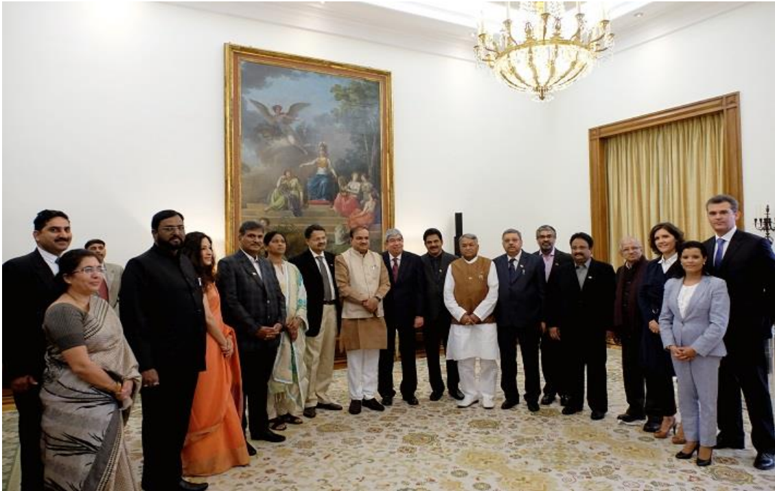
[शिष्टमंडल ने पुर्तगाल गणराज्य की सभा के अध्यक्ष, डॉ. फेरो रोडरिग्स से मुलाकात की]

बधाई दी। मंत्री ने बताया कि भारत के साथ संबंध स्थापित करने वाला यूरोप का पहला देश पुर्तगाल है। मंत्री ने कहा कि वे अगले 500 वर्ष आगे के बारे में सोचते हैं जहां दोनों देश गैर-नवीकरणीय ऊर्जा, सुरक्षित पेयजल, संरचनात्मक ढांचे और सूचना प्रौद्योगिकी जैसे क्षेत्रों में सहयोग कर सकते हैं। उन्होंने आगे कहा कि पुर्तगाल के प्रधानमंत्री महामहिम श्री अंटोनियो कोस्टा जनवरी, 2017 के दौरान प्रवासी भारतीय दिवस, 2017 में मुख्य अतिथि के रूप में बेंगलूरु का दौरा करेंगे। वे संसद सदस्य के रूप में भारतीय संसद में निरंतर 6 बार से भारत की सिलिकॉन वेली के रूप में जाने जाने वाले बेंगलूरु का प्रतिनिधित्व करते आ रहे हैं। उन्हें दोनों देशों के बीच सहयोग को बढ़ावा देने और द्विपक्षीय व्यापार तथा सांस्कृतिक पहलुओं सहित दूसरे क्षेत्रों में सहयोग को बढ़ाने पर काम करने के लिए पुर्तगाल के प्रधानमंत्री के दौरे का इंतजार है। उन्होंने यह भी कहा कि दोनों देशों के बीच व्यापार संभावना से कम है और व्यापार को कई गुणा बढ़ाने की गुंजाइश है। इसके बाद भारत-पुर्तगाल संसदीय मैत्री समूह के सदस्यों के साथ दोपहर के भोजन सहित बैठक हुई जहां दोनों संसदों के सदस्यों को अलग-अलग हर किसी के साथ संवाद करने का अवसर मिला। शाम को संसदीय कार्य मंत्री ने पुर्तगाल की प्रतिष्ठित शख्सियतों जिनमें पुर्तगाल सभा में विभिन्न राजनीतिक दलों के सदस्य शामिल थे, के लिए रात्रिभोज की मेजबानी की जहां द्विपक्षीय हितों/महत्व के विभिन्न मुद्दों पर विचारों का आदान-प्रदान हुआ।