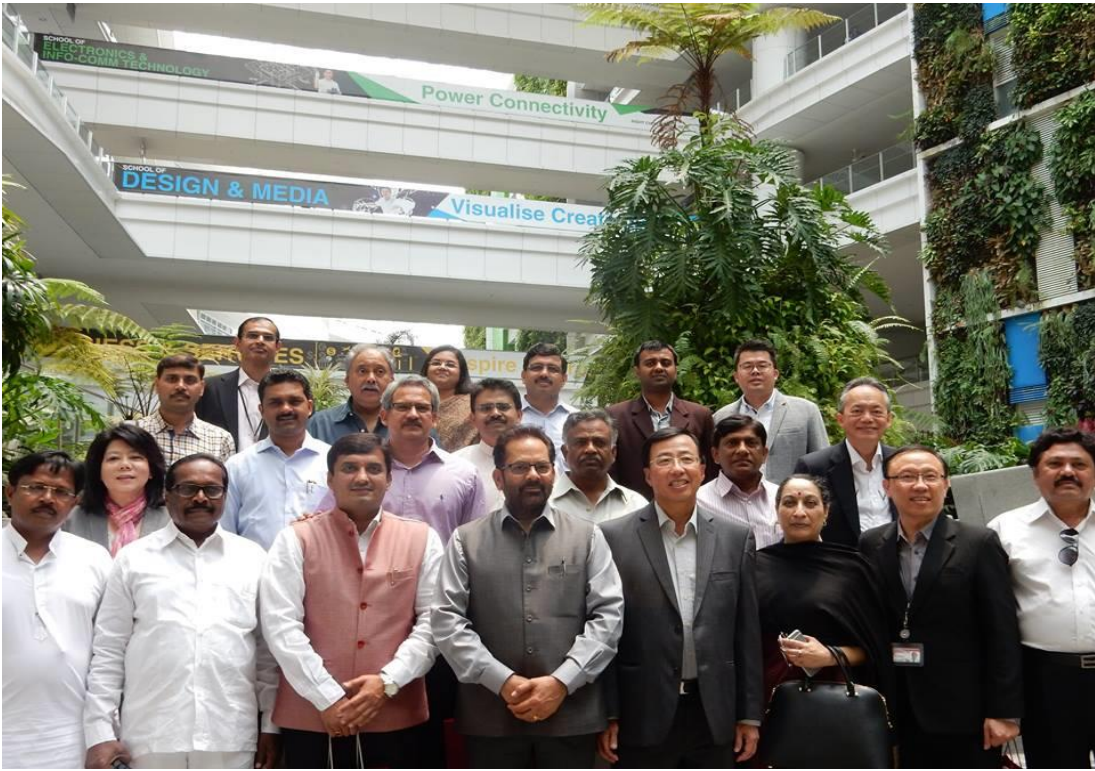
(शिष्टमंडल ने सिंगापुर में इंस्टीट्यूट ऑफ टैक्नीकल एज्यूकेशन (आई.टी.ई.) का दौरा किया)