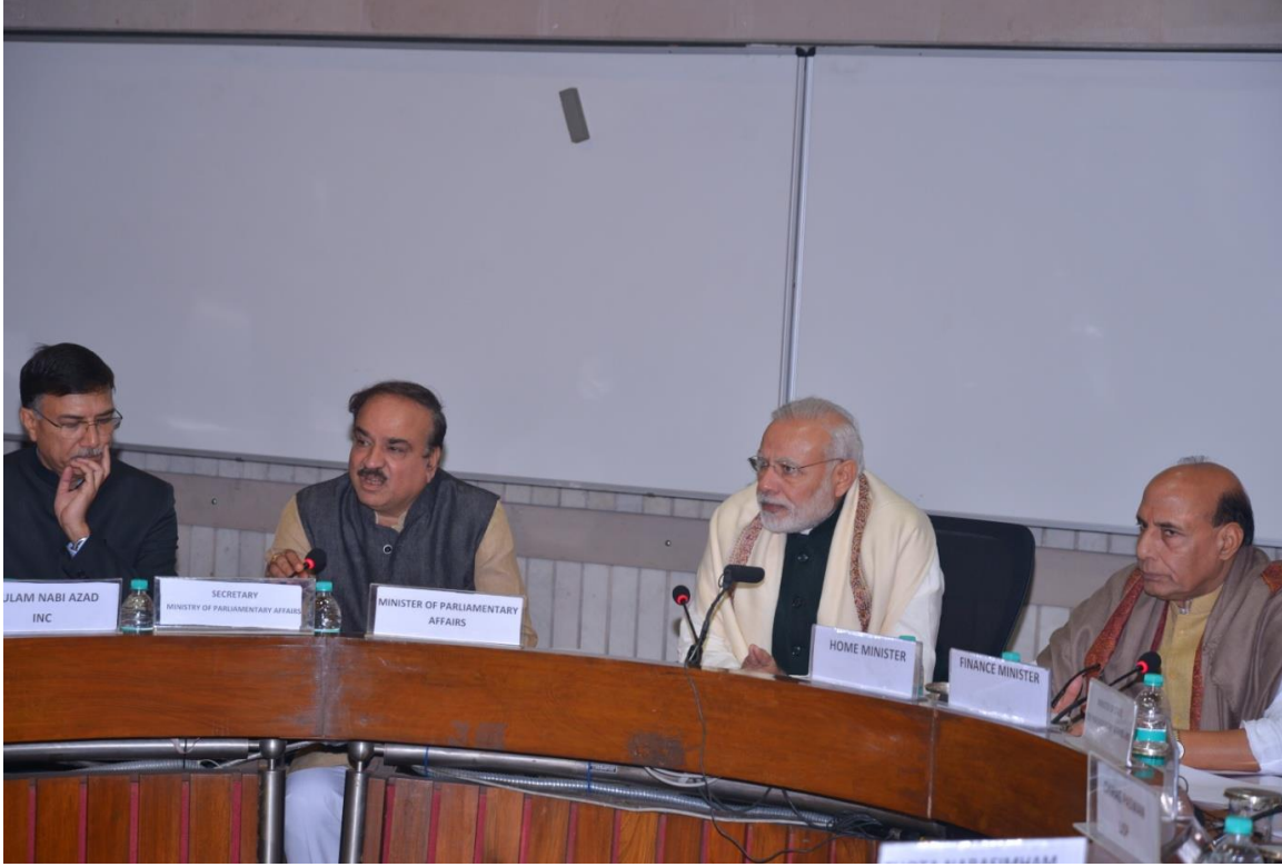
[दिनांक 30.1.2017 को जी-074, संसद ग्रंथालय भवन में आयोजित सर्वदलीय बैठक]